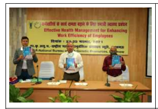
Release of HRD training manual in Inauguration