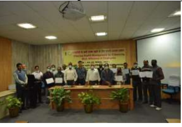
Valedictory session, trainee with certificates with Director, NBFGR.